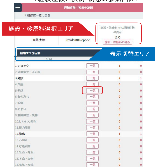
< 経験症候／疾病・病態の参照画面 >