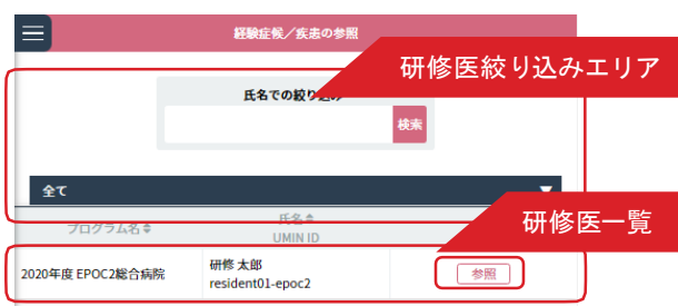
< 研修医一覧画面 >