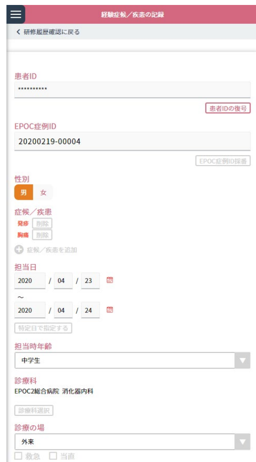
< 経験症候／疾病・病態の表示画面 >