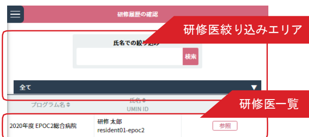
< 研修医一覧画面 >