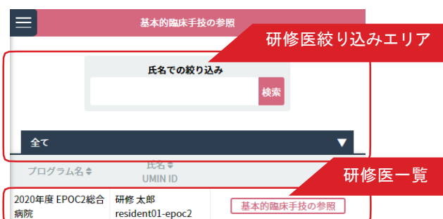
< 研修医一覧画面 >