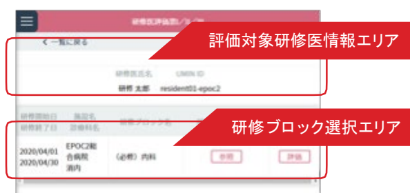
＜研修医詳細情報画面＞