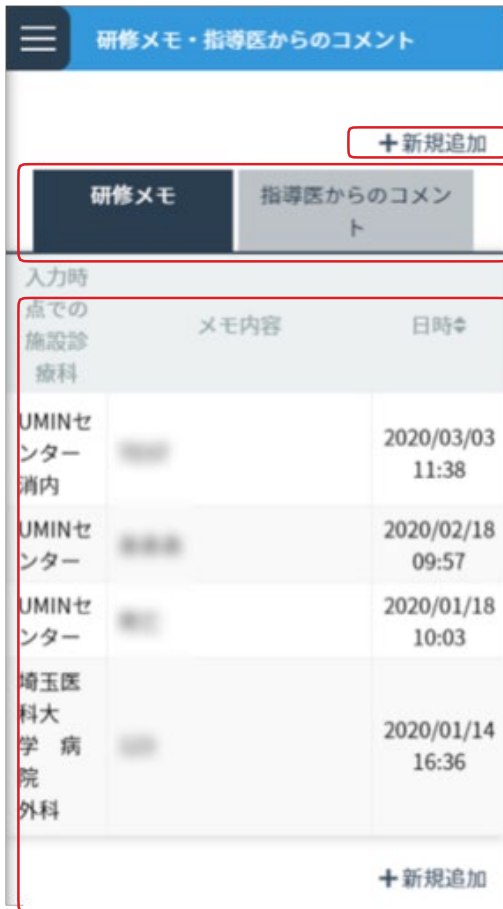
<研修メモ・指導医からのコメント一覧画面>