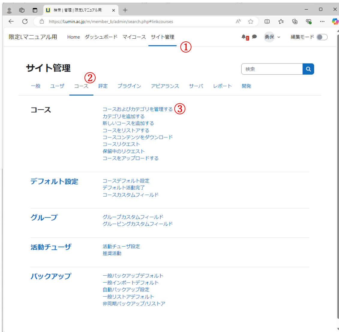
下図 2: サイト管理画面 (例)

サイト管理者権限でログインを行い、上部メニューから「サイト管理」(図2:①)に入ります。サイト管理メニューから「コース」(図2:②)を選択します。コース画面より「コースおよびカテゴリを管理する」(図2:③)を選択します。